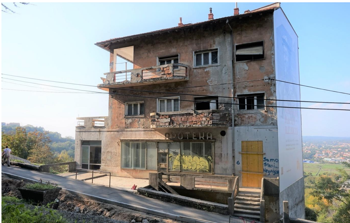
Slika 1: Jugoistočno pročelje bivše apoteke u Ulici Aldo Negri